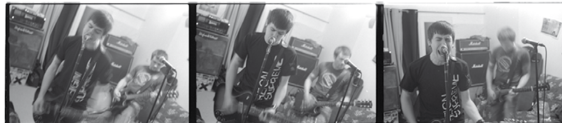
Sling69 en répétition, le 11 février 2008