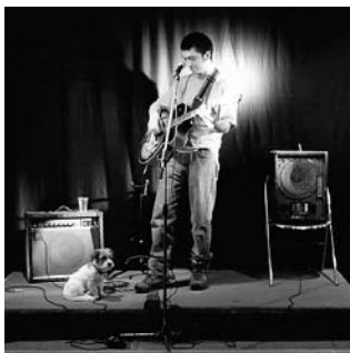
Babel le 05/04 à Chiot et le 28/03 à Laval

Archimède et La Casa seront à l'affiche de la prochaine édition du festival Chorus des Hauts de Seine. La Casa participera aussi aux Chantiers des Francos, dispositif d'accompagnement et de formation du festival des Francofolies de La Rochelle. Quant aux lavallois de k.driver , ils font partie de la tournée 2008 d'Artistes en scène, résidence-formation régionale pilotée par Trempolino et relayée en Mayenne par l'ADDM53 et le 6 par 4.