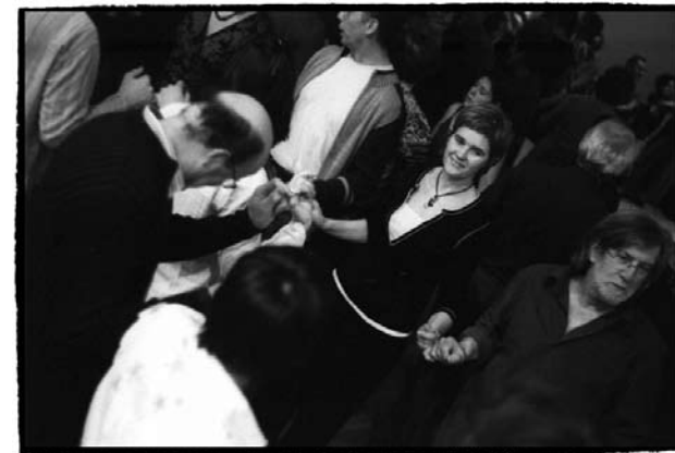
Bal folk à Parné-sur-Roc, le 2 février 2008.