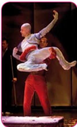
Le Prince de Verre

Retrouvez tous les spectacles musique et danse en Mayenne dans l'agenda en ligne de l'ADDM 53 : www.addm53.asso.fr/-agenda-