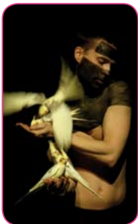
La confiance des oiseaux